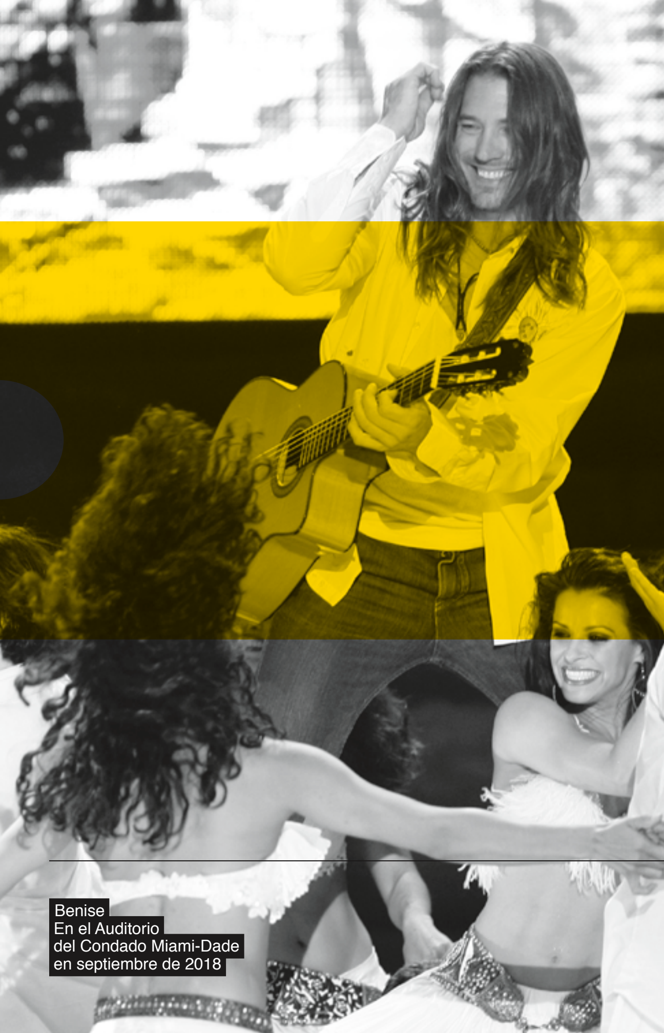
Benise En el Auditorio del Condado Miami-Dade en septiembre de 2018